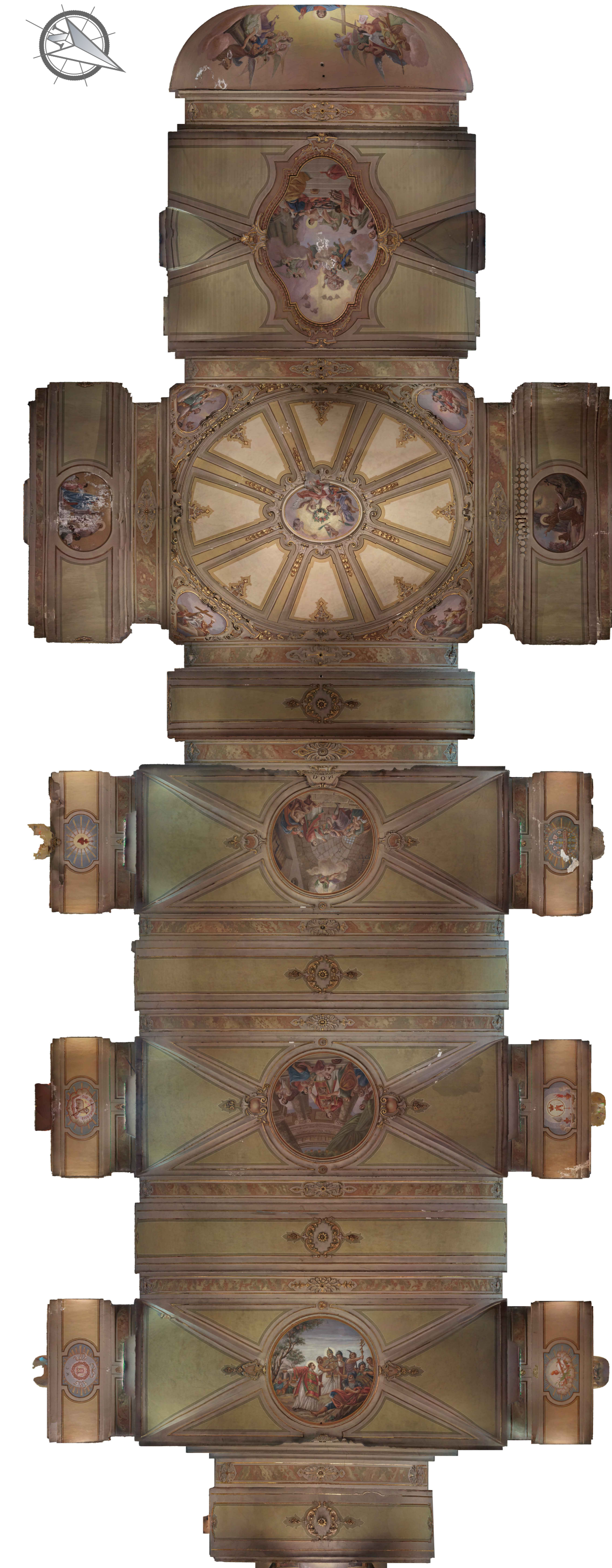
Inquadramento - scala 1:100