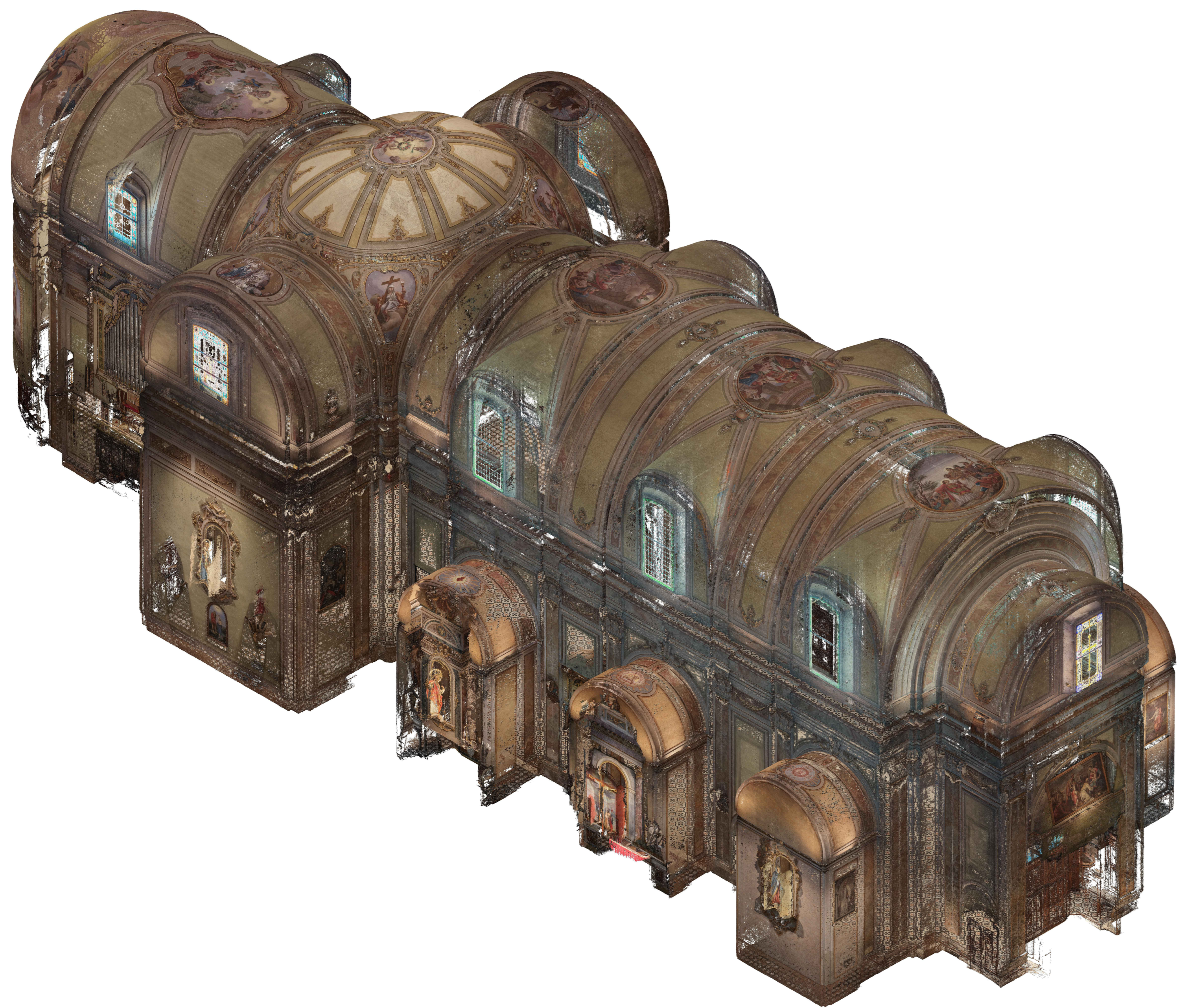
Vista assometrica da NORD