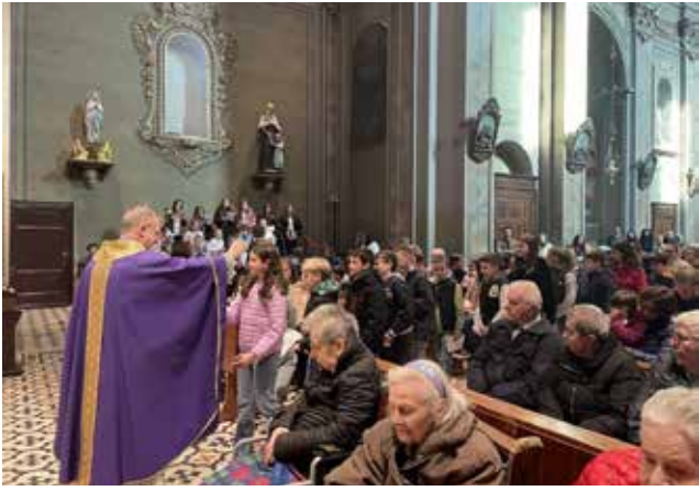
Ammissione ai Sacramenti Gruppo Emmaus.