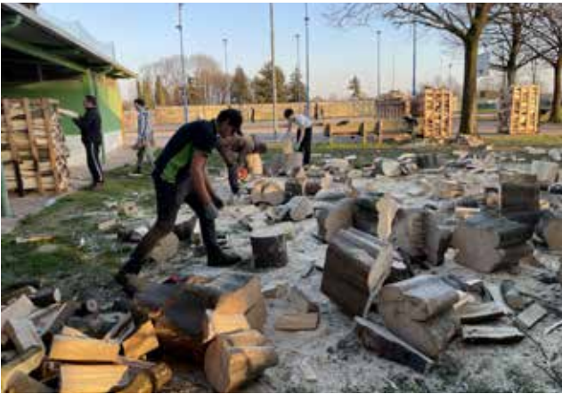
Il Team Oratorio fa scorta di legna per le feste.