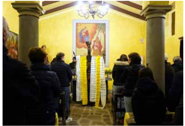
Via Crucis a San Fermo.