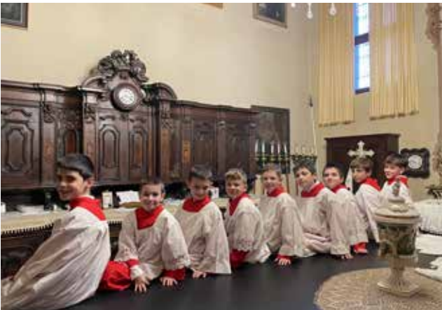
Ministranti in posa.