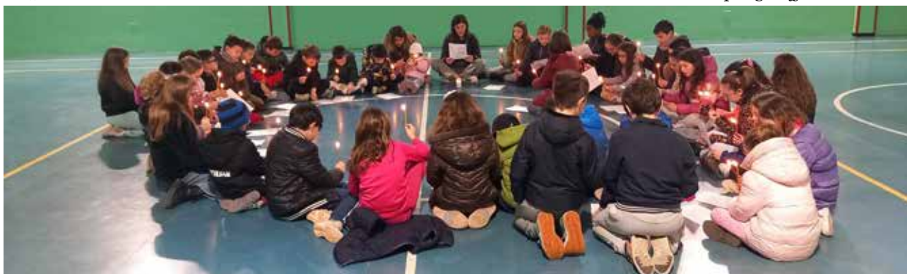
I bambini della Scuola primaria durante la preghiera di Quaresima il giovedì mattina.

A cura del Consiglio per gli Affari Economici