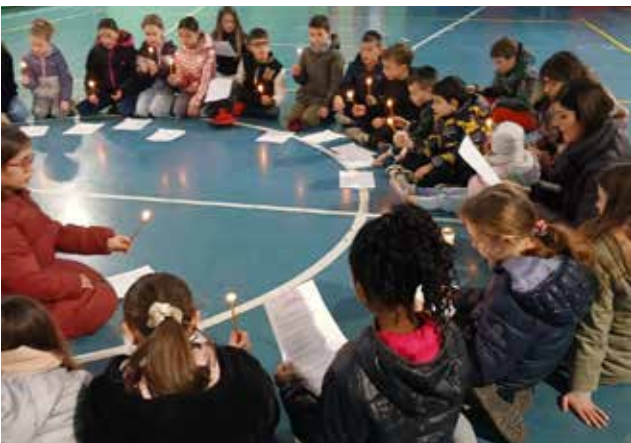
Scuola primaria, preghiera in Quaresima.