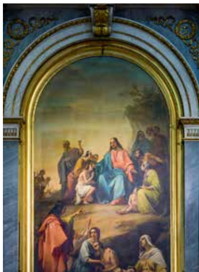
Altare del Santissimo Sacramento Pala di Michelangelo Grigoletti Duomo Nuovo - Brescia Le Beatitudini

Diventa indispensabile interrogarci sul significato della parola “beato”. È la situazione in sé a rendere beati, oppure è beato colui che sa cogliere la