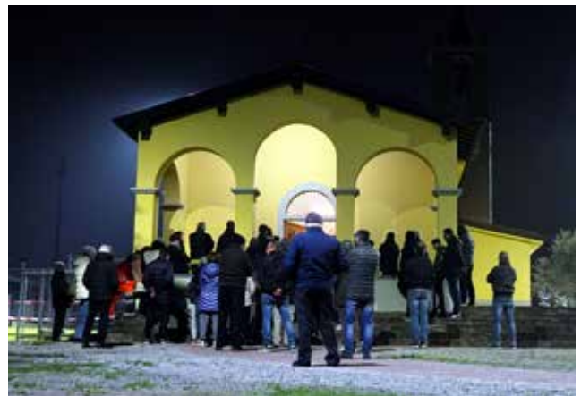
Via Crucis a San Fermo.