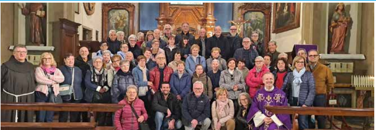
Pellegrini al Sacro Monte di Orta - 21 marzo 2026.