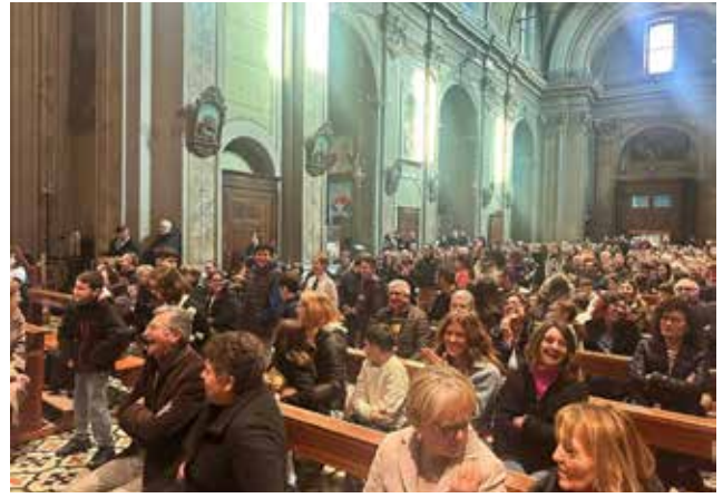
Consegna doni Spirito Santo Gruppo Emmaus.