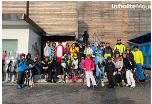
Sci Club, Carnevale a Colere.