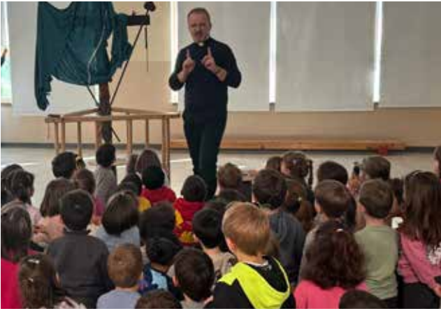
Quaresima, preghiera con i bambini, a Scuola.