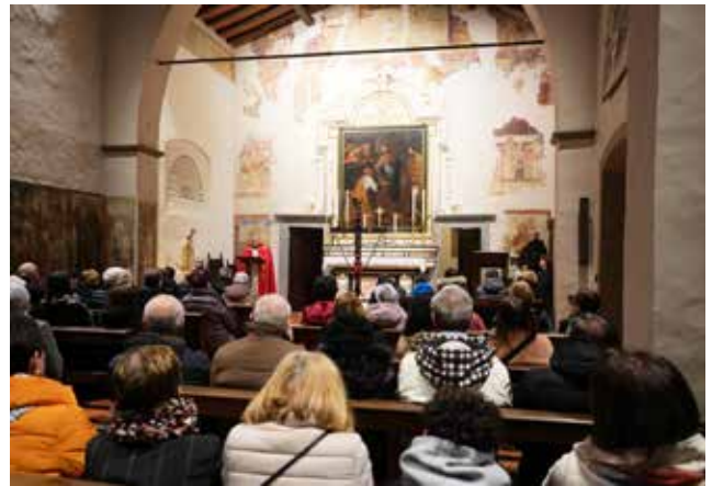
Via Crucis a San Pietro.