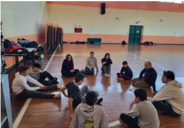
Preadolescenti durante il ritiro di Quaresima.