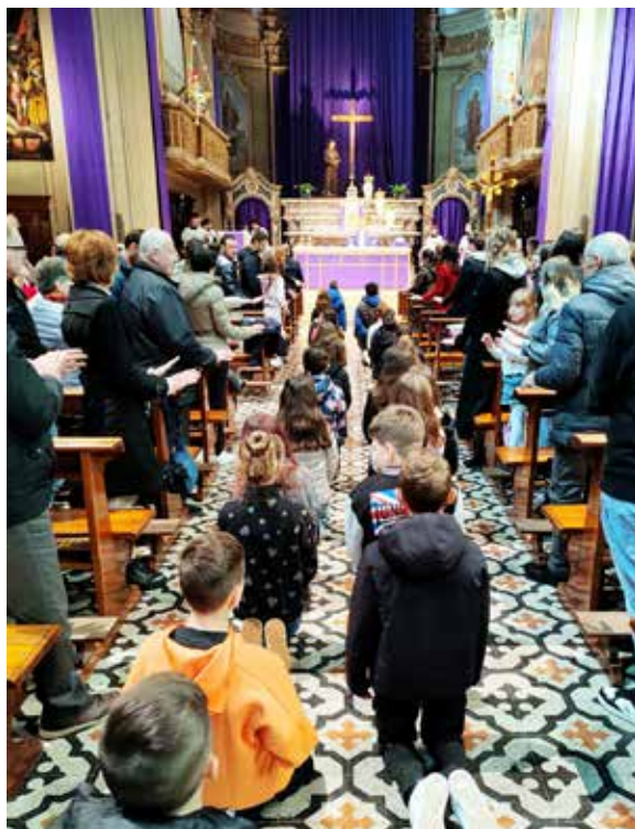
Interno parrocchiale di Palosco Celebrazione con il Gruppo Emmaus.