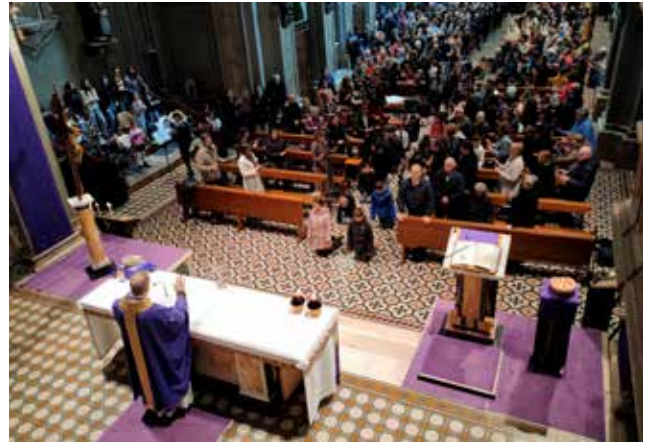
Avvio del camino di Quaresima.